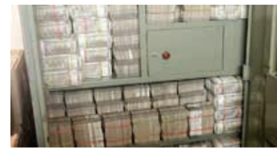
यह कंपनी अधिकांश उत्पादों का निर्यात विदेशों यानी यूएसए, यूरोप, दुबई और अन्य अफ्रीकी देशों में करती है. आयकर ने 6 राज्यों में करीब

हेदराबाद। आयकर विभाग ने हेटेरो फार्मास्यूटिकल ग्रुप पर छोपे मारे रेड करने वाले अफसर तब दंग रह गए, जब उन्हें 142 करोड़ रुपये कैश दफतर की अलमारियों में पड़ा मिला।