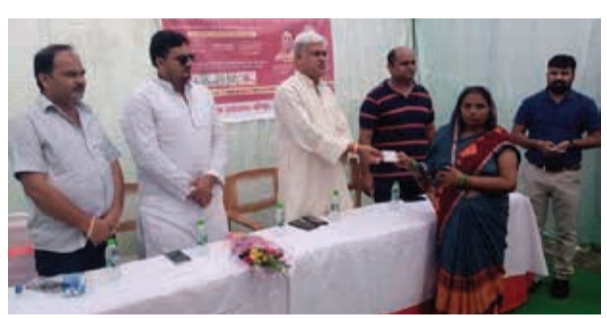
प्रधानमंत्री नरेंद्र मोदी और प्रदेश के मुख्यमंत्री योगी आदित्यनाथ द्वारा आमजनमानस के लिए जनकल्याण कारी योजनाएं संचालित की जा रही है जो उपयोगी साबित हो रही हैं।

सोतापुर। देश के प्रधानमंत्री नरेंद्र मोदी द्वारा चलाई जा रही योजना आयुष्मान गोल्डेन कार्ड के तहत प्रदेश सरकार द्वारा दिशा निर्देश के अनुपालन मे लाखो लोगो को आयुष्मान गोल्डेन कार्ड वितरित किये गए।