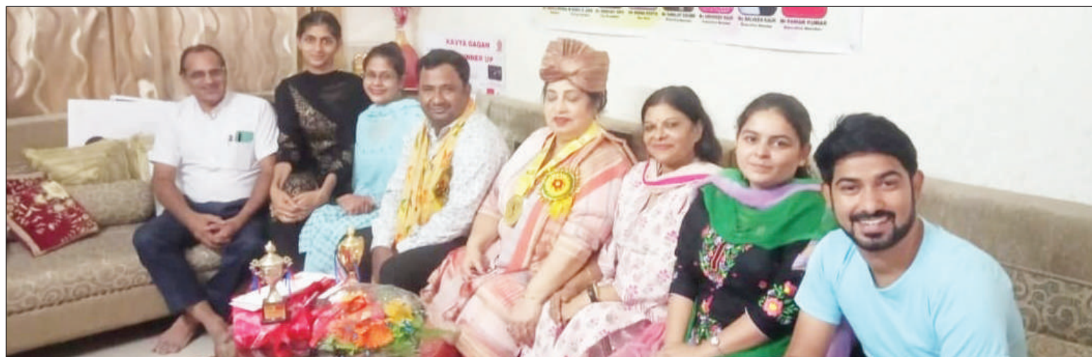
साहित्य24 डॉट कॉम पंजाब इकाई की पूरी टीम।